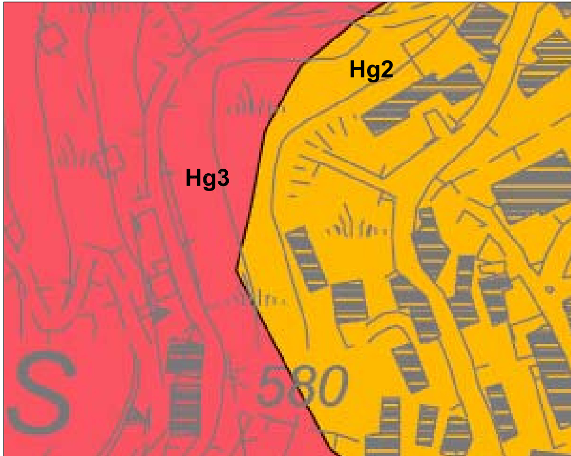
Perimetrazione area a pericolosità idrogeologica tratta dalla cartografia ufficiale del P.A.I.